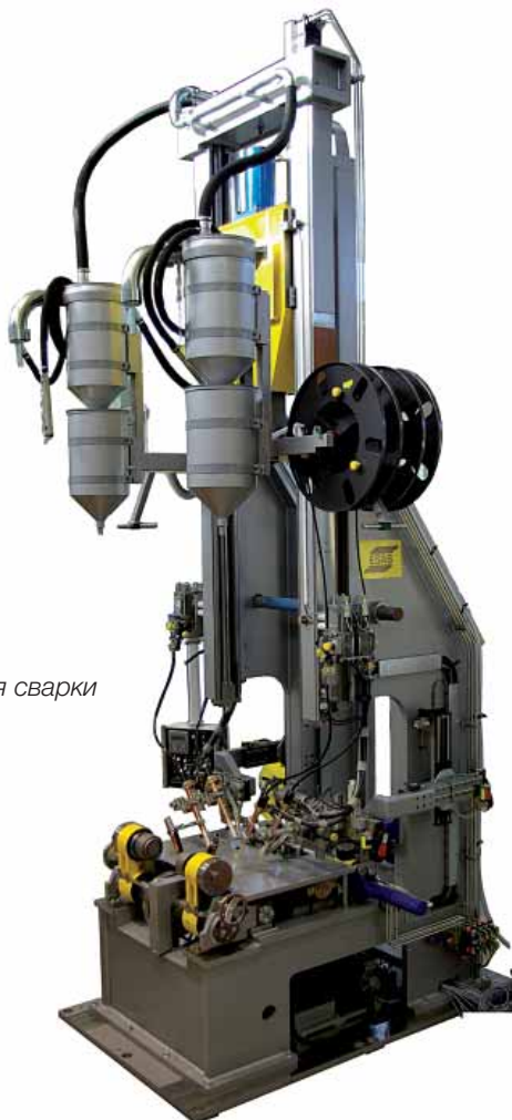
Установка для сварки балок IT-258